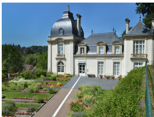
Château de l'Églantine © Musée de la Toile de Jouy

Depuis 2010, la Mairie et l'Association des Amis du Musée de la Toile de Jouy se mobilisent pour enrichir les collections, valoriser les expositions et développer les partenariats pour faire de ce Musée un site culturel majeur du territoire yvelinois. En 2021, le Musée a suscité l'intérêt et l'engouement des visiteurs en accueillant, malgré la crise sanitaire, plus de 10 000 visiteurs, l'ambition étant de développer prochainement un véritable centre d'activités culturelles, économiques, et touristiques autour de l'impression sur textile, dans le sillage de la Manufacture Oberkampf.