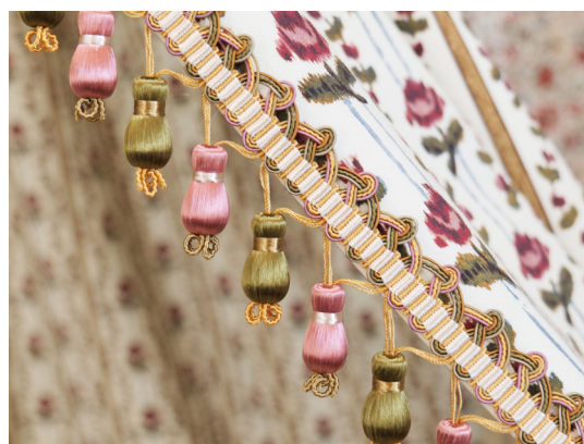
Détail d'une passementerie d'un ciel de lit

La pièce est meublée d'une psyché, d'une coiffeuse, d'un lit et d'une paire de fauteuils à la reine. Les garnitures ont pu être recrées grâce aux archives familiales. Anne-Elisabeth choisissait parmi les plus belles toiles imprimées de la manufacture pour confectionner ses intérieurs. La chambre confronte les styles, en mélangeant un motif indien à une décoration typiquement européenne. La tenture murale, dans une perse de Jouy, est inspirée des « fleurs étranges » de l'Inde. La parure et le ciel de lit quant à eux, sont confectionnés dans la toile « Roses chinées » imitant le dessin des soieries françaises, qui influencent l'industrie textile au XVIII e siècle.