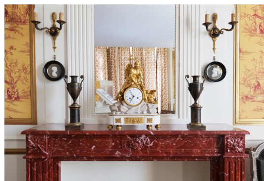
Salon de musique inspiré des intérieurs de la famille Oberkampf

En outre, cet outil de médiation permet de composer sa propre Toile de Jouy à l'aide de motifs historiés et contemporains. Chaque toile sera mise en lumière dans cette salle où la création n'a aucune limite.