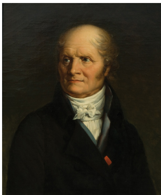
Portrait de Christophe-Philippe Oberkampf par François Gérard, 1818-1819

Sa trajectoire peu commune fait de ce simple ouvrier immigré, un des pionniers de l'industrie.